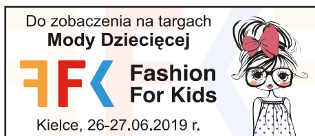
IMAGE PRESS publishing house