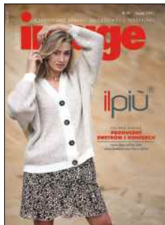
materiał na okładce: DALBE