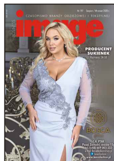
materiał na okładce: BOSSCA FASHION