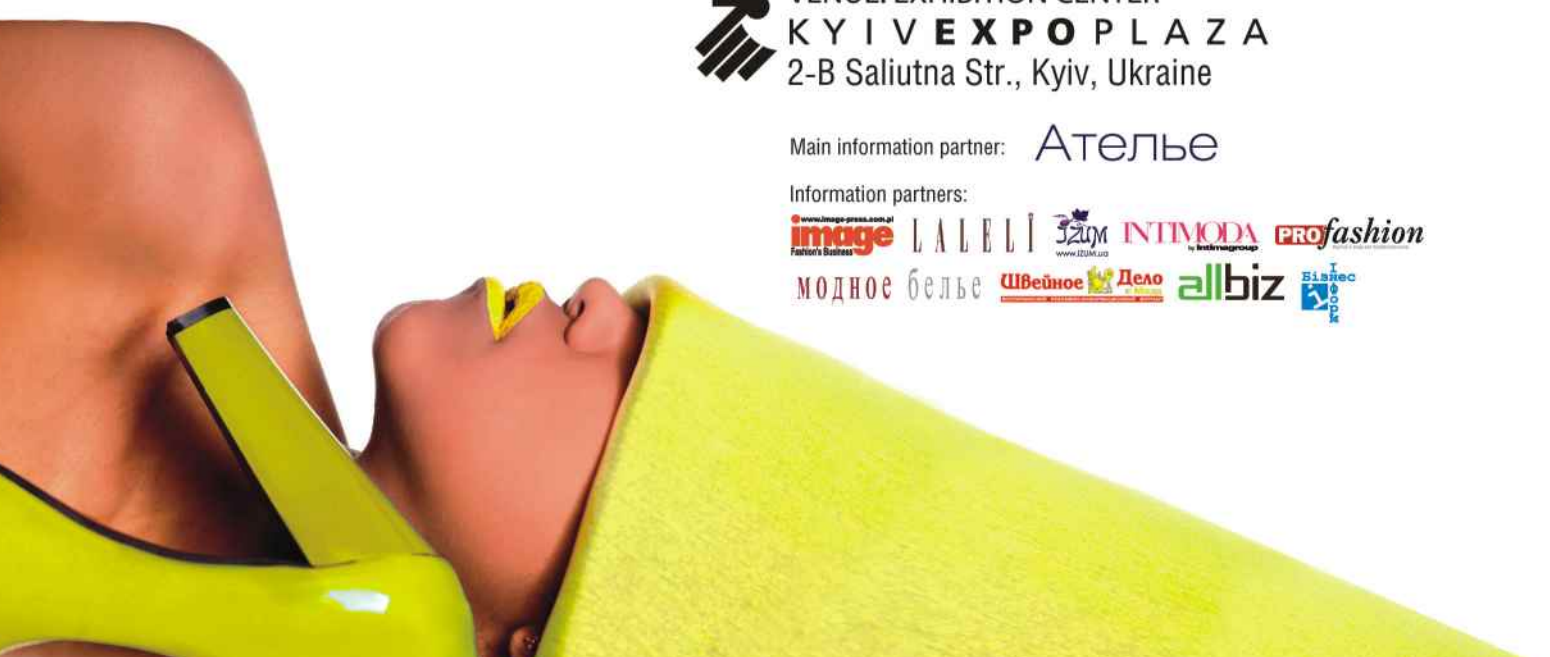
image Fashion's Business САБЕЛІ ІЗІМ INTIMODA PROfashion модное белье Швейное Дело allbiz Sisrec